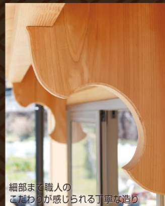
細部まで職人のこだわりが感じられる丁寧な造り

漆喰や焼杉板などの自然素材、無垢の木材を使い、伝統的な技を持つ職人が創り上げました。「住まいの伏見」では一般住宅から純日本家屋まで、伝統的な「木」を最大限に利用し特徴を活かした趣ある永く残る住宅建築を心がけています。まずは、伏見の家づくりをご体感ください。