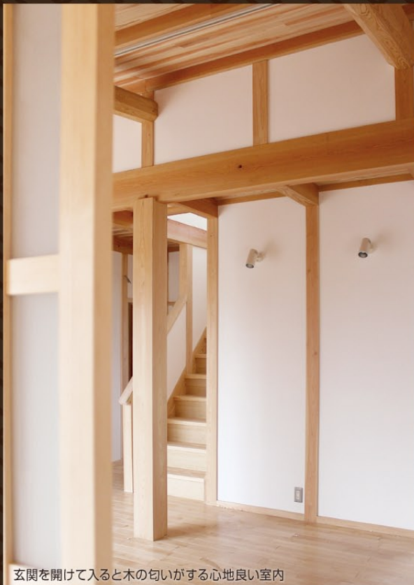
玄関を開けて入ると木の匂いがする心地良い室内

開催日時 3/23 土・24 日 会場 都窪郡早島町早島 10:00~16:00