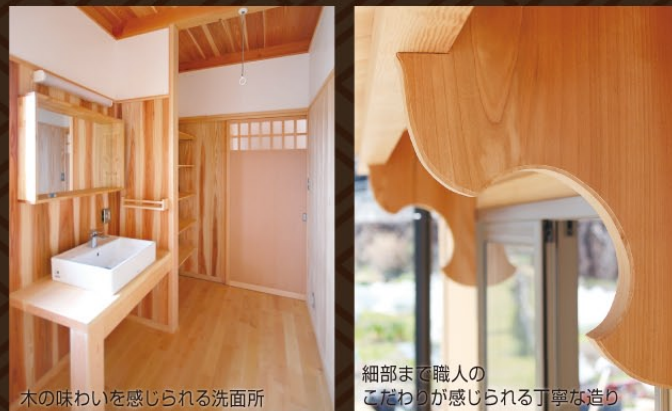
木の味わいを感じられる洗面所