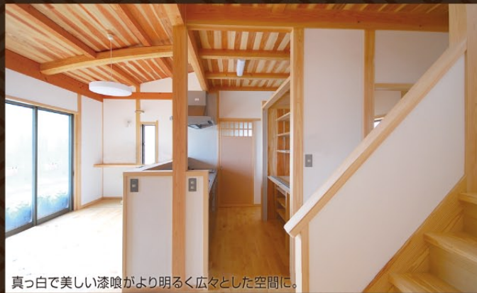
真っ白で美しい漆喰がより明るく広々とした空間に。